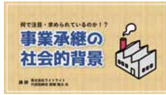
Chapter02 事業承継の社会的背景