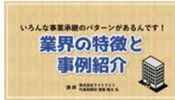
Chapter05 業界の特徴と事例紹介