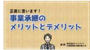
Chapter03 事業承継のメリットとデメリット