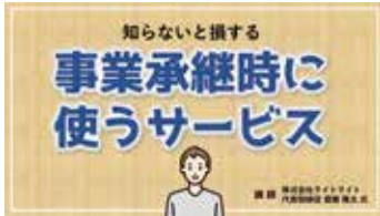
Chapter04 事業承継時に使うサービス